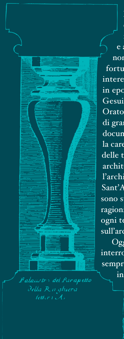
Palanstra del Parapetto della Chiesa della Reguera lettera A.