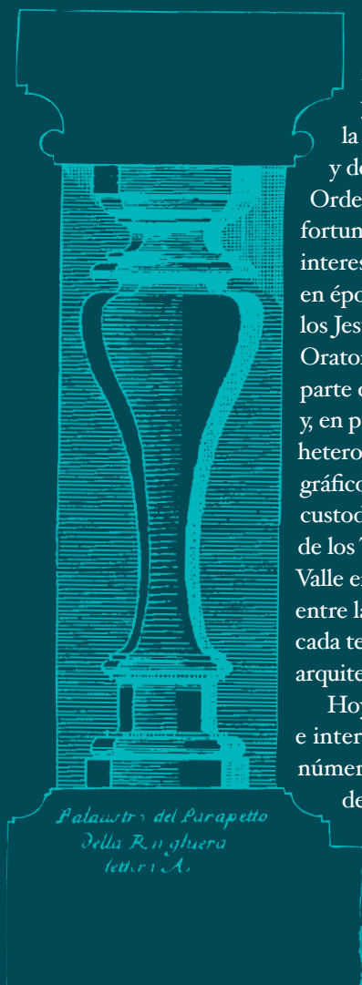
Palanstra del Parapetto della Ringhiera lettera A.